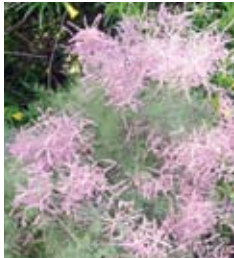
אשל סיני Tamarix Chineseis

יש בידינו אפשרות לבחור בצמחייה מתאימה מתוך מגוון רחב של פרחים, שיחים ועצים בשלל צבעים, היכולים ליצור גינה יפה וצבעונית, שצריכת המים בה נמוכה. דוגמאות כאן ובהמשך.