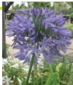
אגפנטוס Agapanthus Spp.