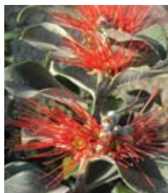
ברזילי תומס תפוז Metrosideros Thomasil