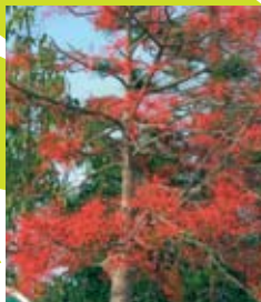
ברכיטון אדרי Brachychiton Acerifolius