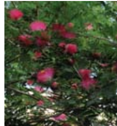
קליאנדרה אדומת פרי Calliandra Haematocarpa