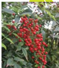
ננדינה תרביתית Nandina Domestica CVS