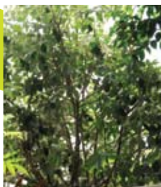
פגויה Feijoa Sellowiana