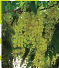
פריחת כסיית האבוב Cassia Fistula

נהוג לדרג את הצמחים על פי צריכת המים שלהם, בסולם אפס עד ארבע, כשאפס מייצג את הצמח העמיד ביותר למחסור במים, וארבע מייצג את הצמח הבזבזן מכולם. לפניכם דוגמאות לצמחים יפים ומוכרים לרוב הציבור, מרביתם מדורגים בצריכת מים נמוכה (2).