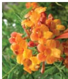
דק-פרי אורנג' ג'ובילי Tecoma Orange Jubilee