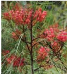
גרווילאה ג'ונסון Grevillea Johnsoni