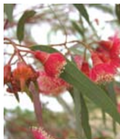
אקליפטוס הצווארון Eucalyptus Torquata