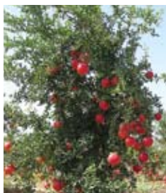
רימון מצוי Punica Granatum